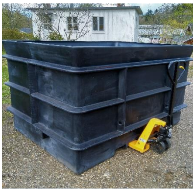
Praktiske løfteøjer og spor til palleløfter/gaffeltruck, gør karret let at håndtere.