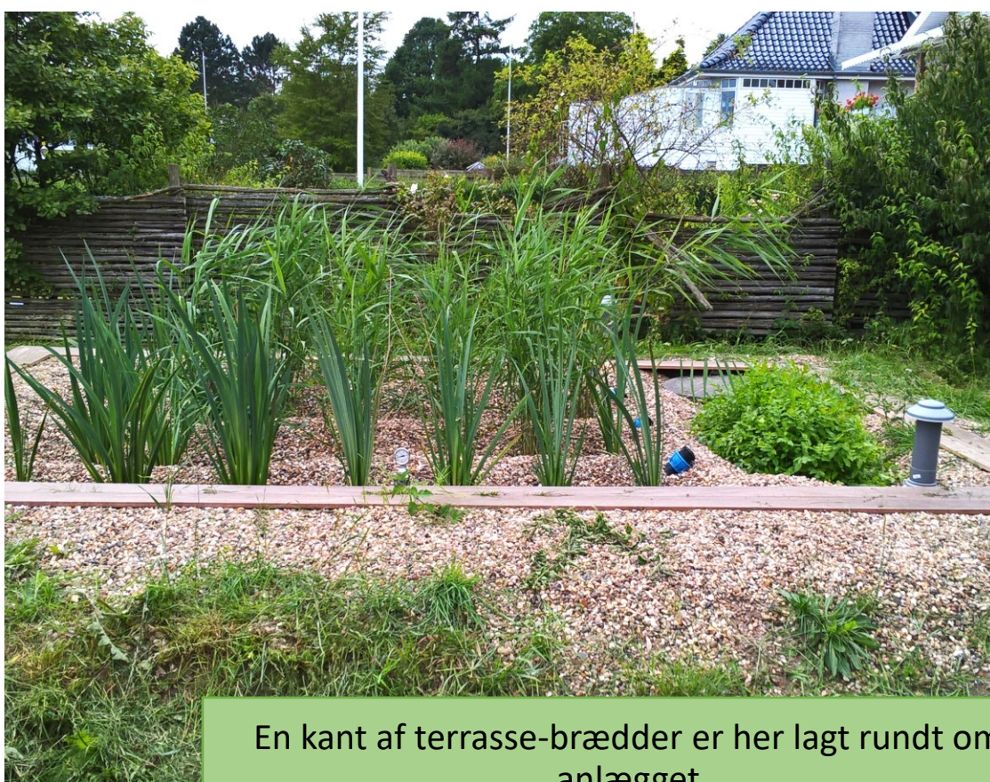
En kant af terrasse-brædder er her lagt rundt om anlægget

En lodret kant som går ned i jorden, vil hindre rødder i at sprede sig ind i anlægget. Den vandrette belægning skal have en vis bredde for at være effektiv mod rod-ukrudt.