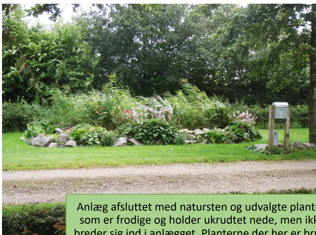
Anlæg afsluttet med natursten og udvalgte planter, som er frodige og holder ukrudtet nede, men ikke breder sig ind i anlægget. Planterne der her er brugt er bl.a. Hosta og Sankthansurt.