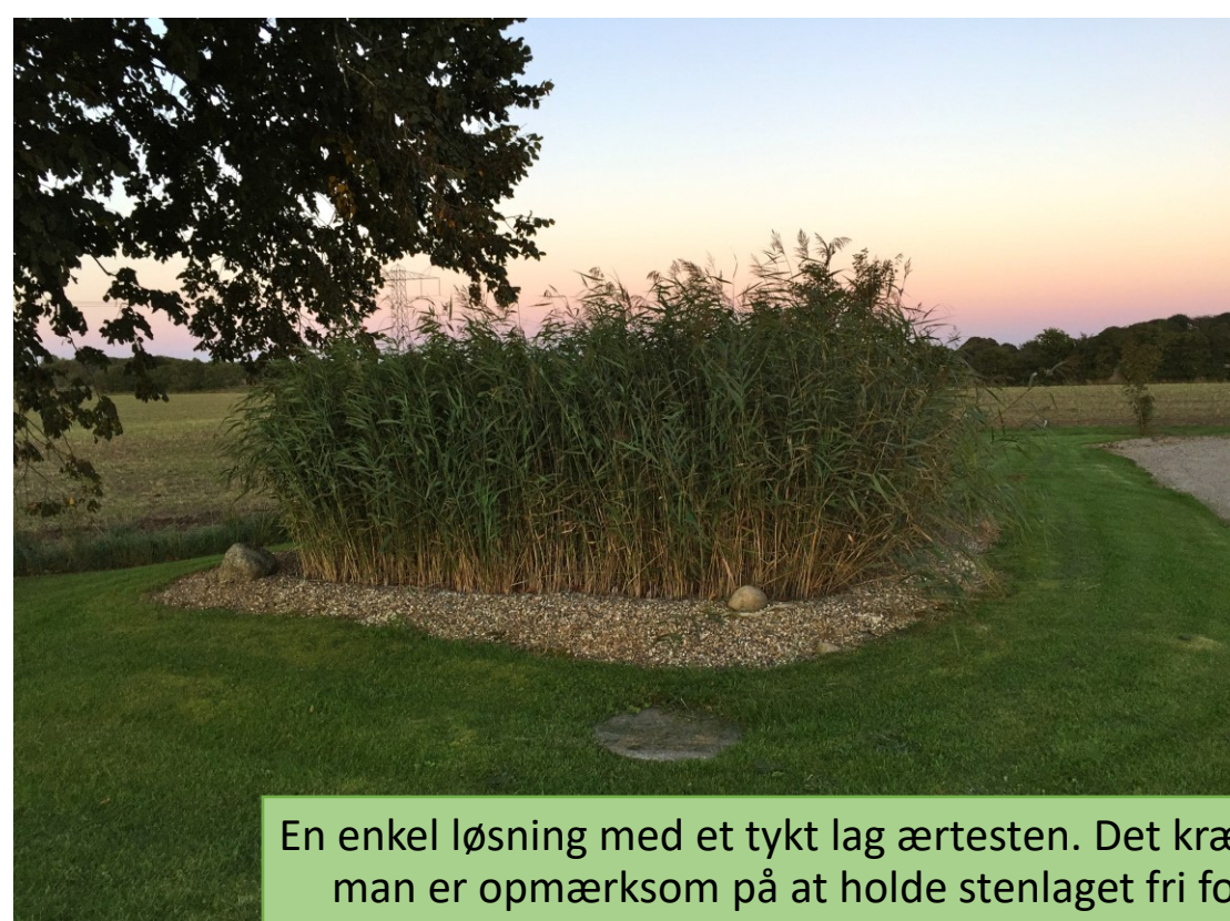
En enkel løsning med et tykt lag ærtesten. Det kræver man er opmærksom på at holde stenlaget fri for ukrudt