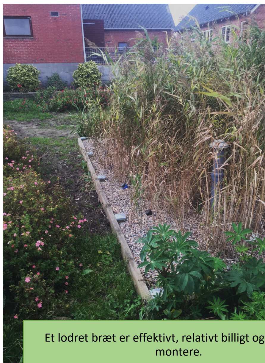
Et lodret bræt er effektivt, relativt billigt og enkelt at montere.

En lodret kant som går ned i jorden, vil hindre rødder i at sprede sig ind i anlægget. Den vandrette belægning skal have en vis bredde for at være effektiv mod rod-ukrudt.