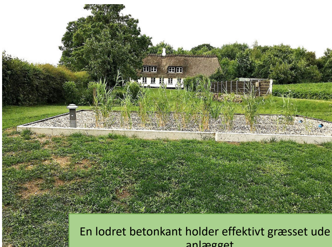
En lodret betonkant holder effektivt græsset ude af anlægget.

Det beplantede filteranlæg er et lille stykke natur med lettilgængelige næringsstoffer og vand, så mange planter vil gerne slå rødder her. Når anlægget er nyetableret, er tagrør og iris ikke så store at de dækker hele filter-arealet. Planterne får bedst mulighed for at få at komme hurtigt i vækst og fylde anlægget ud, hvis de har arealet for sig selv og ikke kæmper mod senegræs, brændenælder osv. Du hjælper planterne på vej ved at luge, og kan desuden vælge at lave en lille kant rundt om anlægget, for at sikre det ikke invaderes af indtrængende ukrudt fra siderne. Her kan du se forskellige flotte løsninger og lade dig inspirere.....Hvordan skal DIT anlæg se ud ?