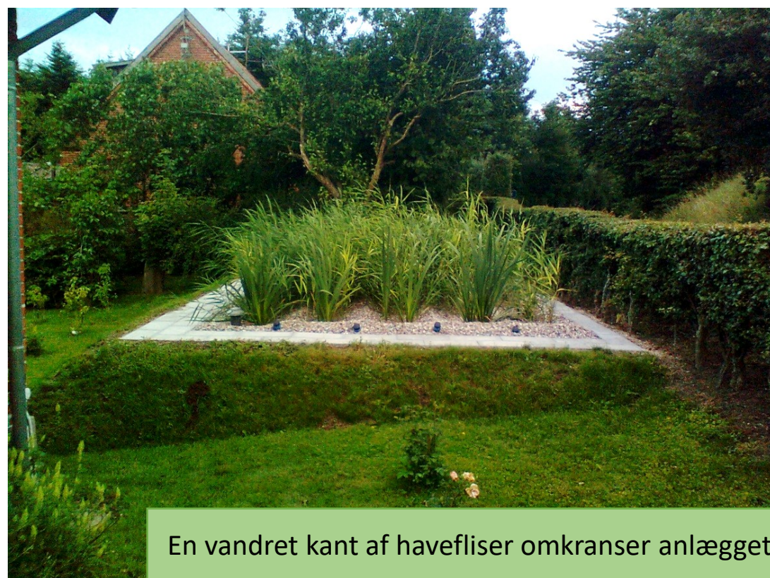
En vandret kant af havefliser omkranser anlægget her