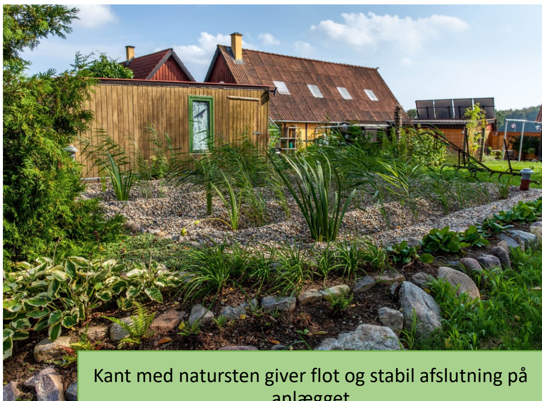
Kant med natursten giver flot og stabil afslutning på anlægget