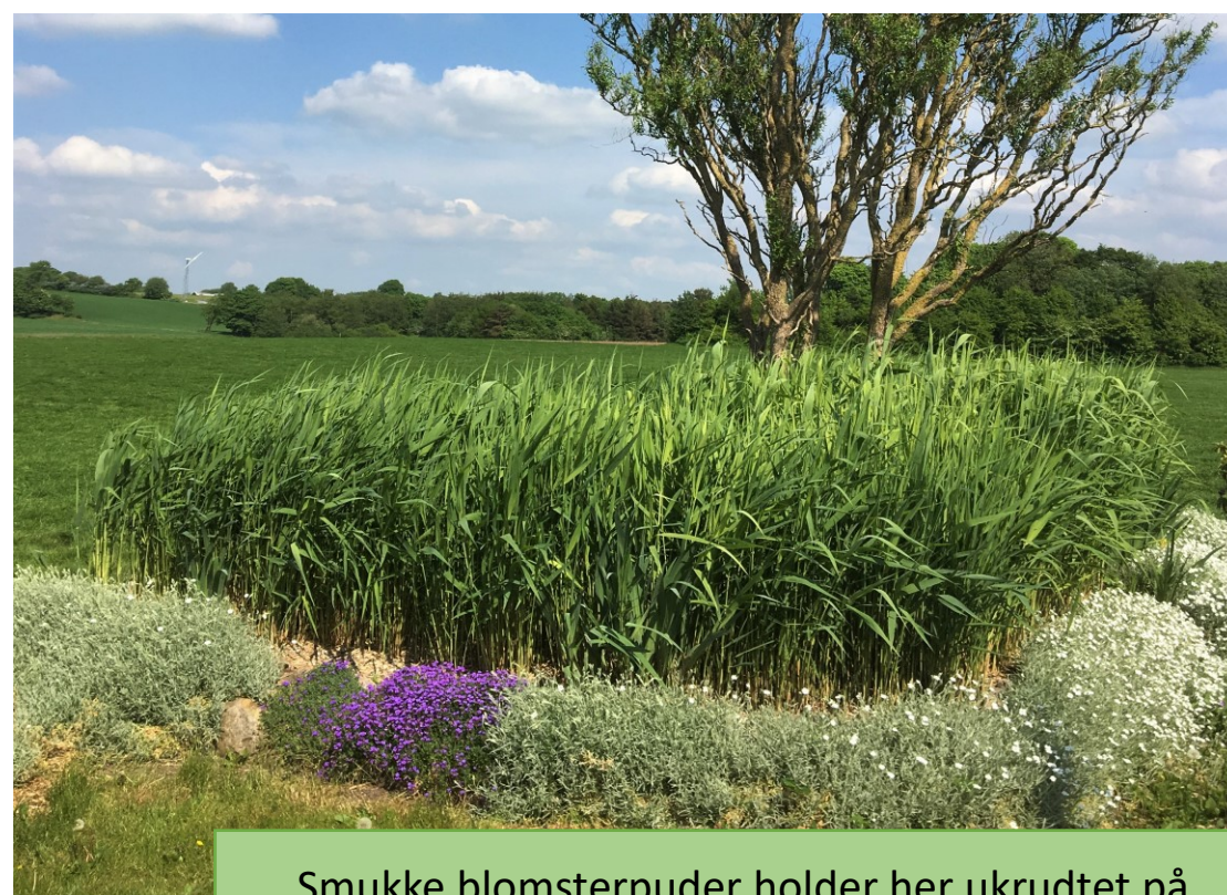
Smukke blomsterpuder holder her ukrudtet på afstand