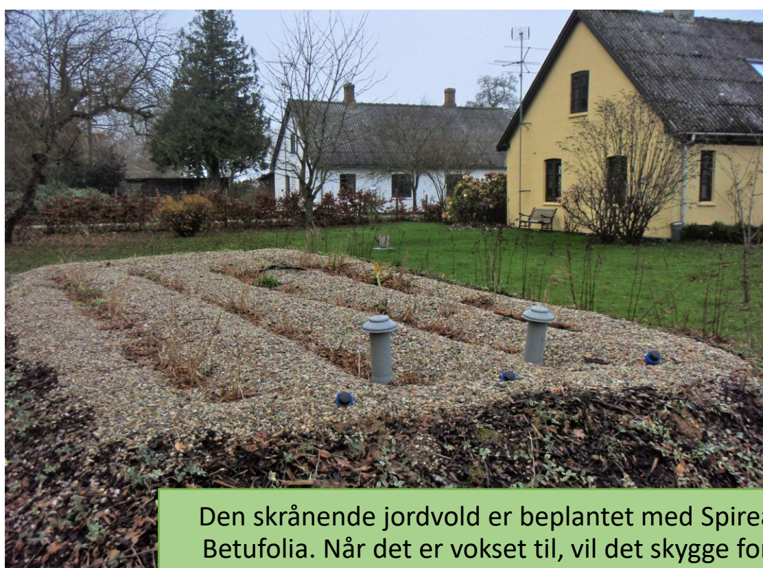
Den skrånende jordvold er beplantet med Spirea Betufovia. Når det er vokset til, vil det skygge for ukrudt og dermed beskytte anlægget.