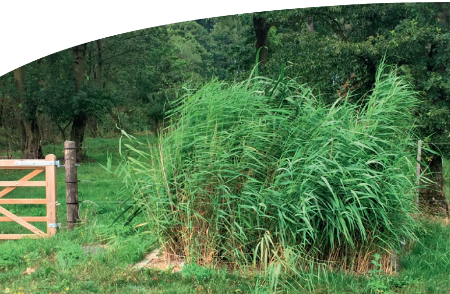
Beplantet filter smukt integreret i omgivelserne.