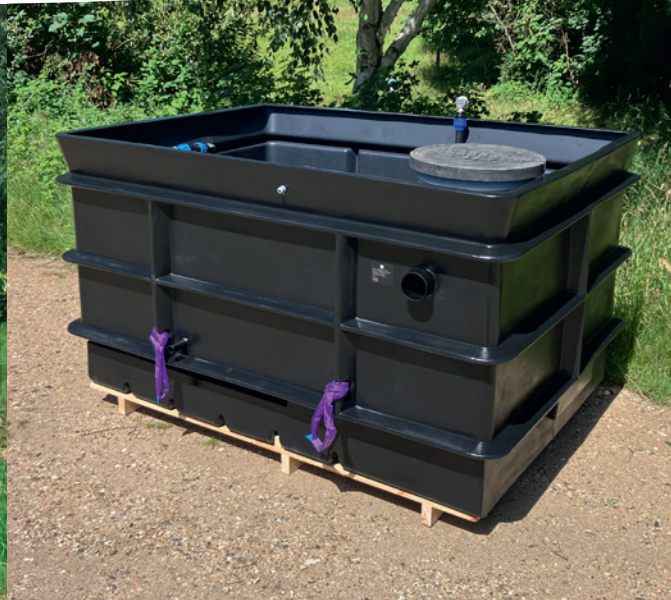
Kar klar til nedgravning

Med Kilian-karret er din spildevandsrensning hurtig på plads. Det formstøbte kar leveres komplet med planter og alle nødvendige komponenter. Det skal blot fyldes op med ærtesten, beplantes og tilsluttes. Du får et anlæg, der benytter naturens egne rensemetoder. Derfor er det enkelt og robust med et strømforbrug helt i bund. Planterne optager CO 2 og næringsstoffer, giver biodiversitet og et smukt bidrag til din have.