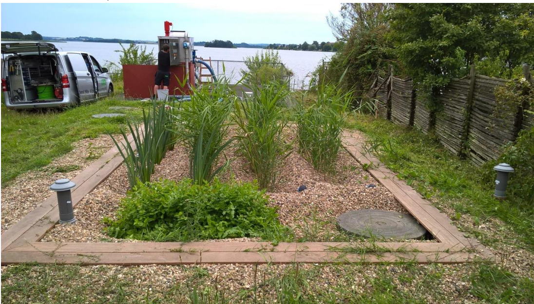
Figur 1. Billede af de to testanlæg ved Skanderborg Sø; forrest kan ses en beplantet løsning og bagerst i rød en ristløsning i kombination med desinfektion.

Resultaterne af projektet er en varslingsmodel, der ud fra reelle data i Skanderborg og en kompliceret modellering nu varslor badegæsterne ved søbadet via en automatisk varslingsstavle, hvis der er risiko for, at bakterier fra overløb nedsætter badesikkerheden.